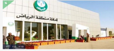
الرياض | سوق التحرير

مئة الرياض: تنفيذ 100% من البلاغات الخطرة وتلقى 18 ألف ملاحظة خلال أسبوع