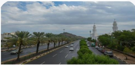
المواطن - الرياض

خدمت أمينة المدينة المنورة العديد من الإرشادات التي يجب اتباعها عند هطول الأمطار، وذلك بالتزامن مع توفقات المركز الوطني للأرصاد، لحالة مطرة تتعرض لها مناطق المملكة. أوضح أمينة المدينة المنورة عبر حسابها الرسمي بموقع تويتر، أن الإرشادات التي يجب اتباعها عند هطول الأمطار، هي ما يلي: