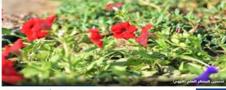
٢٠ ألف زهرة تزين كورنيش دارين تتمتع بلدية الخيف بمساحة من الأراضي المخصصة للزراعة في إطار حرص البلدية التأكيد من نظامية عملها حسب الاشتراطات المحددة للزراعات المنتجة وجهودها في تنظيم منطقة "فود ترك" بالعليا.