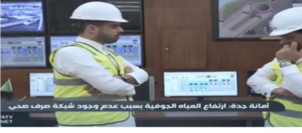
أمانة جدة: ارتفاع المياه الجوفية بسبب عدم وجود شبكة صرف صحي للمواطنين - جدة

0 2021-12-16 الساعة 11:05 من 13 مقالته: أهمية شبكة الصرف