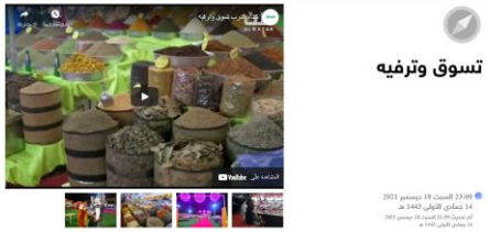
تسوق وترفيه | 23-06-2021