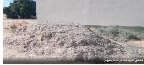
البلديات تشهده المنظر الفداح (اليوم)