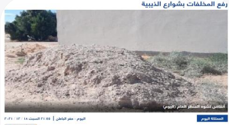
رفع المخلفات بشوارع الذيبية | اليوم - ظهر الباطن | السبت 18 / 12 / 2021