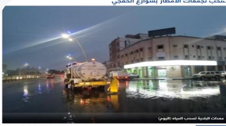
سحب تجمعات الأمطار بشوارع الخفجي | اليوم - السبت 18 / 12 / 2021