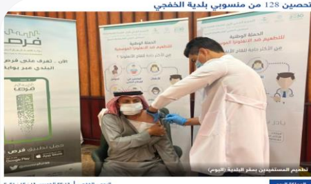
تحصين 128 من منسوبي بلدية الخفجي اليوم - الخميس 11 / 11 / 1431 هـ

واصلت بلدية محافظة الخفجي بالتعاون مع إدارة المستشفى العام وبمراكز الصحية، عمليات حملة تطعيم منسوبي البلدية.