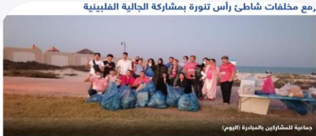
مع مخلفات شاطئ رأس تنورة بمشاركة الجالية الفلبينية وأصليت بلدية رأس تنورة أعمالها ضمن برنامج إطاعة في مبادرة «الشرفية نظيفة» للشهر الجاري عن طريق شاطئ رأس تنورة تحت شعار «شركل - كيمكل - علف - ديركل» ومبادرات «هدفنا» بمشاركة الجالية الفلبينية والمطبخين. وكثفت البلدية أعمال الرقابة العامة بالمحافظة، بتنفيذ جولات رقابية تفقيسية على مساكن ومخيمات التجمعات والسوق المركزية والمطاعم للتأكد من تطبيق الاشتراطات والقوانين والتدابير الوقائية للحد من انتشار فيروس كورونا