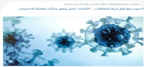
تتساقط أمانات مناطق المنطقة، عبر جهود وحدات رقابية منوعة، لتكثيف الإجراءات الاحترازية والتدابير الوقائية لتحد من انتشار فيروس كورونا، وتطبيق القرار، مع العمل بالتزامن على تنفيذ التدابير الصحية 4946 بمنتهى الحرص.