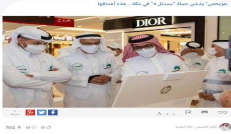
مكثن أمين العاصمة المقدسة ورئيس مجلس إدارة القويحص حملة "ممتثل ٢" في أحد المراكز التجارية، والتي تهدف إلى مساندة جهود الرقابة البلدية، وتعزيز سلوك الأفراد المجتمعية، بجانب التوعية بأهمية الالتزام بالإجراءات الاحترازية، "بروتوكولات الصحة الوقائية والحكم من انتشار فيروس كورونا".