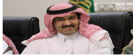
استطاع المرفوع العام على البرنامج السعودي لتأهيل وإعمار اليمن المساهمة في تطوير البنية التحتية للبلديات، وذلك من خلال زيارة اليمن والوقوف على الواقع الميداني للبلديات، والتعرف على الجهود المبذولة في تطوير البنية التحتية للبلديات، وذلك تحت إشراف اللجنة الوطنية للتعاون الدولي والإسكان والتنمية الحضرية والريفية، وذلك بحضور وفد من اللجنة الوطنية للتعاون الدولي والإسكان والتنمية الحضرية والريفية، وذلك بحضور وفد من اللجنة الوطنية للتعاون الدولي والإسكان والتنمية الحضرية والريفية، وذلك بحضور وفد من اللجنة الوطنية للتعاون الدولي والإسكان والتنمية الحضرية والريفية.