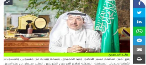
ولد الحميدي يقع أصل منطقتنا عسير الدكتور ولد الحميدي - باسمه وبنائه عن مسؤوبه ومسؤوبات الأمانة وبلديات المنطقة الشفاعة لخدم الحرمين الشريفين الملك سلمان بن عبدالعزيز واسمو ولي عهد الأمين الأمير محمد بن سلمان - حفظهما الله - بمناسبة يوم التأسيس الذي يعد مناسبة وطنية عالية على جميع أبناء الوطن، وتؤكد عمق التاريخ المحمد للدولة السعودية على مدى ثلاثة قرون، مبنياً أنه منذ تأسيس الدولة السعودية الأولى في عهد الإمام محمد بن سعود وهي ترتكز على مبادئ الشريعة الإسلامية، والتحكم الرشيد، والتطوير التنموي، ليكون للمملكة دور كبير ومكانة عالية على الصعيدين الإقليمي والعالمية.

الحميدي تأسيس الدولة السعودية الأولى نقطة تحول في التاريخ