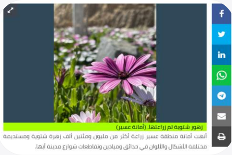
زهور شتوية تم زراعتها (أمانة عسير) أنهت أمانة منطقة عسير زراعة أكثر من مليون ومئتين ألف زهرة شتوية ومستخدمة مختلفة الأشكال والألوان في حدائق وميادين وقاطعات شوارع مدينة أبها.