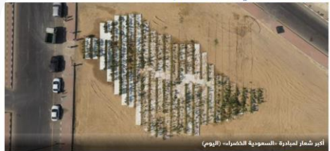
أكثر مشار لمبادرة «المسؤولية الخضراء» (اليوم)