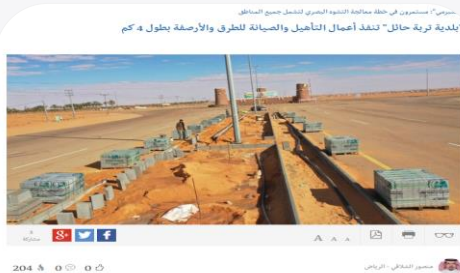
نقلت بلدية مدينة تربة حائل عملية صيانة وإعادة تأهيل أعمال الطرق والأرصفة بطول 4 كم في حي الأحياء السكنية، وذلك بالتعاون مع إدارة الطرق والأرصفة بطول 4 كم في حي الأحياء السكنية.