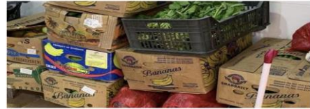
جولات رقابية مكثفة

بالصور.. مصادرة أكثر من نصف طن أغذية فاسدة في جولات رقابية بالعاصمة المقدسة