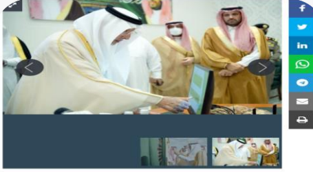
أعلن مستشار خادم الحرمين الشريفين أمير منطقة مكة المكرمة الأمير خالد الفيصل أن إجمالي قيمة المشاريع المزمعة والتاري، تنفيذها والمتمثلة من مناصفات الضيقة والالت وأضم والعرضيات، بلغت ما يزيد على 3 مليارات و700 مليون ريال، جاء ذلك لدى زيارته للمنصافات.