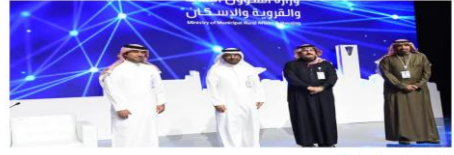
وزير الإسكان يكرم دار وإعمار لرعايتها الرئيسية لمنتدى مستقبل العقار ومشاركتها في معرضه المصاحب

كرم معالي وزير الشؤون البلدية والقروية والإسكان الأستاذ ماجد بن عبدالله الحقييل -تمهكة- دار وإعمار للاستثمار والتطوير العقاري - تقديراً لريادتهما الرئيسية لمنتدى "مستقبل العقار" والتي أطلقت فعالياتها اليوم الأربعاء وعلى مدار يومين في فندق فورسيزون الرياض، حيث قام الرئيس التنفيذي للمديرية الأستاذة الحذيري باستلام الدرع التكريمي من راعي الحدث، خلال حفل الافتتاح.