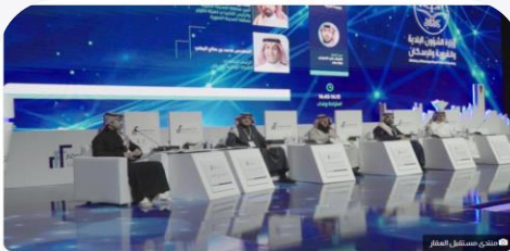
قال نائب وزير الشؤون البلدية والقروية والإسكان المهندس عبدالله بن محمد البدير، إن رؤية المملكة 2030 ترتكز على مجتمع حيوي ووطن طموح واقتصاد مزهر.

جاء ذلك خلال حديثه في الجلسة الحوارية الرابعة بعنوان "صناعة التطوير العقاري وجوده الداه" ضمن أعمال "منتدى مستقبل العقار" في نسخته الأولى والمقام بمدينة الرياض على مدى يومين.