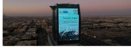
الفعاليات يوم التأسيس بجدة

يُشهد فريق العمل عبدالعزيز النفاذى بأروق العجامة وعدد من الطرق والميادين، احتفاءً بيوم التأسيس، وذلك ضمن فعاليات أمانة محافظة جدة تحت شعار "يوم بريحاء". وشملت أعمال الزينة والإضاءة، وإطلاق المسابقات والفنون الشعبية والتشكيلية، من عمارات وشوارع الحج والاعتزاز على التأسيسات والتوجهات المستقبلية.