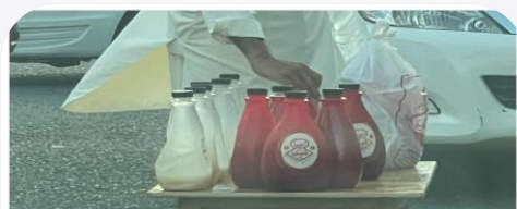
استبدال الأكياس المشروبات السوبيا بطوات بلاستيكية محاربة للتلوثات