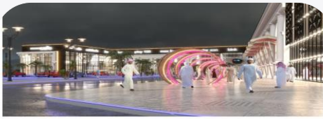
بلدية محافظة عسير تلح في استقطاب العديد من الاستثمارات