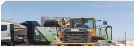
أمانة الطائف تزيل مخلفات المباني والتفايات الصلبة