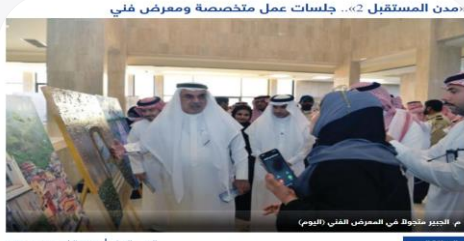
م. الخبير متجول في المعرض الفني (اليوم)