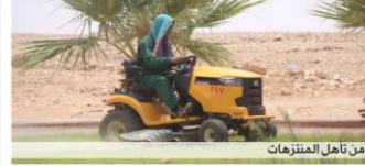
من تأهل المنتزهات

بلدية الزلفي تزيل التشوه البصري وتؤهل منتزهاتها