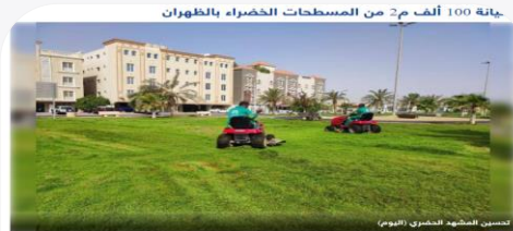
صيانة 100 ألف م٢ من المسطحات الخضراء بالظهران أتمت إدارة الحدائق والتجميل ببلدية الظهران التابعة لأمانة المنطقة الشرقية، صيانة 100 ألف متر مربع من المسطحات الخضراء إضافة إلى صيانة 100 من الحدائق والأشجار والتشجير بشارع "البحر"، وذلك بالتعاون مع شركة "الظهران" المتخصصة في الصيانة والتشجير. وذلك من خلال حوكمتها الميدانية على المنشآت التابعة، مع استكمال الإجراءات النظامية.