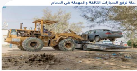
حملة لرفع السيارات التالفة والمهملة في الدمام رفعة 80 سيارة تالفة ومهملة أطلقت أمانة المنطقة الشرقية بالتعاون مع الجهات المعنية أمس، حملة لرفع السيارات التالفة والمهملة في المنطقة الصناعية "مجمع الخضراء"، أسفرت عن رفع 80 سيارة تالفة ومهملة.