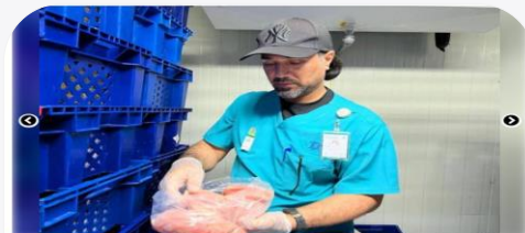
اتلاف 1900 كلجم دواجن مجهولة المصدر اتلاف 1900 كلجم دواجن مجهولة المصدر اتلاف 1900 كلجم دواجن مجهولة المصدر