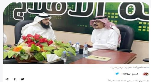
وضع محافظ الأفلاج الدكتور أحمد العلم عدداً من مطالب الأهالي في يدي وكيل الأمانة لشؤون بلديات المنطقة الدكتور عبدالرحمن بن ناصر الخريف، على هامش زيارته للمحافظة، لإطلاق على سير العمل في بداية الأفلاج ومخارزها ومستهدفاً بعضاً الخدمية.