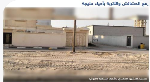
مع الحشائش والأتربة بأحياء مليجة اليوم مليجة | 09 / 13 / 2022 نفذت بلدية مليجة مبادرة بإزالة الحشائش والأتربة والمخلفات من داخل الأحياء، كونه من مركز المصبي، وذلك ضمن معالجة التشوه البصري، وتحسين المشهد الحضري.