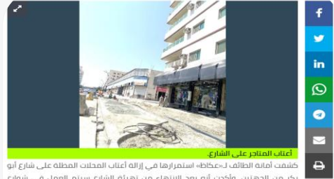
أعتاب المتاجر على الشارع

كشفت أمانة الطائف لـ«عكاظ» استمرارها في إزالة أعتاب المحلات المظلمة على شارع أبو بكر من الدهليز، وأخذت أنه بعد الانتهاء من نهضة الشارع سيتم العمل في شوارع أخرى. ورصدت «عكاظ» إزرام أصحاب المحلات في شارع أبو بكر بإزالة الأعتاب البارزة وإحلالها ضمن حرم المحلات، وشملت أعمال التطوير -إلى جانب إزالة الأعتاب- توسيع