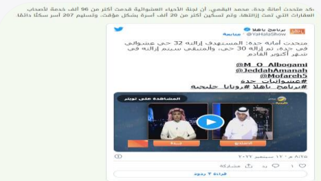
الكل سيتم تعويضه: وتنفيذ البلديات، خلال معالجة إبي برنامج "أهلاً الصالح على قناة روتانا خليجية، أن اكتمال المعاملة هو العامل الأساسي لأولوية حذف التوثيق، حيث أن كل سيتم تعويضه من يمتلك ملكية العقار المزور إزالته أو لا يمتلك.