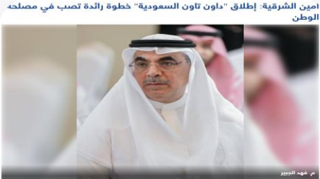
الأمير التشرقية: إطلاق "داون تاون السعودية" خطوة رائدة تصب في مصلحة الوطن