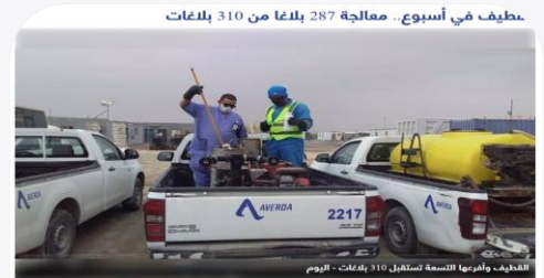
قطيف في أسبوع.. معالجة 287 بلاغا من 310 بلاغات

استقبلت بلدية محافظة القطيف وأفرعها التابعة المتميزة في مواقع مختلفة بالمحافظة خلال أسبوع، من يوم الأحد 9 من مارس، حتى يوم السبت 11 من مارس، في إدارة الطرق والبلاغات، 310 بلاغات. مجموع 287 بلاغاً، بينما كان 23 بلاغاً تحت المعالجة، أي بنسبة 92.5%.